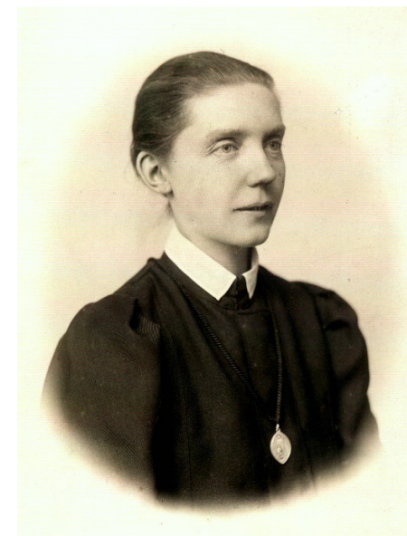
Sel. Maria Theresia Ledochowska 1863 –1922

„Es ist eine grosse Gnade, für die Missionen arbeiten zu dürfen und das Missionswesen zu verstehen.“