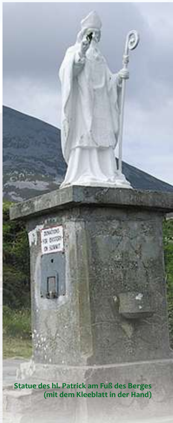
Statue des hl. Patrick am Fuß des Berges (mit dem Kleeblatt in der Hand)