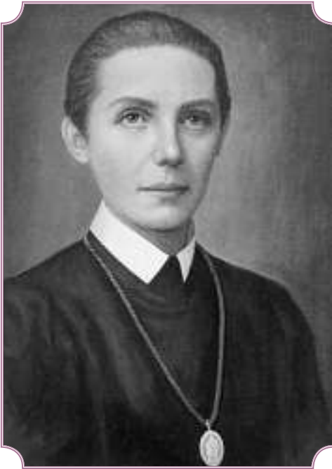
Sel. Maria Theresia Ledochowska