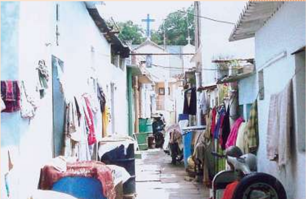
Unsere Liebe Frau von Lourdes, eingezwängt in den engen Lebensraum des Slum.

Die Pfarrei Band Lines befindet sich in einem Slum der Stadt Hyderabad. Die Menschen dieser Gegend sind zugezogen von verschiedenen Teilen des Staates Andhra Pradesh. Sie kamen auf der Suche nach Arbeit und leben nun als Handlanger, Hausgehilfen, einige wenige als Angestellte. Die Missionare der Erzdiözese Hyderabad haben ausgezeichnete Arbeit geleistet und den Samen des christlichen Glaubens gepflanzt. Dadurch wuchs die katholische Bevölkerung in und um Band Lines ständig an. Im Jahr 1994 wurde eine eigene Pfarrei gegründet.