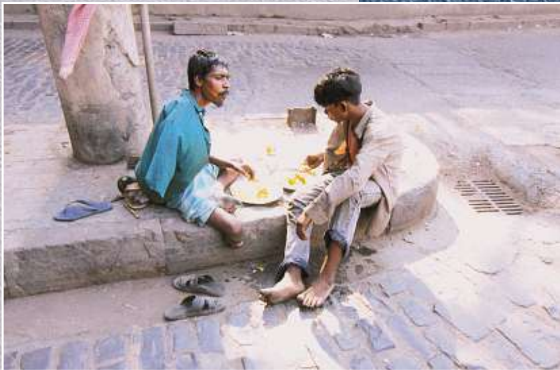
Essensausgabe für Hungernde auf den Straßen Kalkuttas