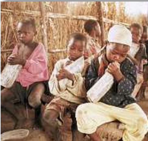
Schulunterricht für die Kinder im Tschad, Moundou

Von den Projekten, die Sie in der ganzen Welt im vergangenen Jahr unterstützt haben, werden sehr viele noch lange gute Früchte tragen und vielen Völkern Hilfe bringen.