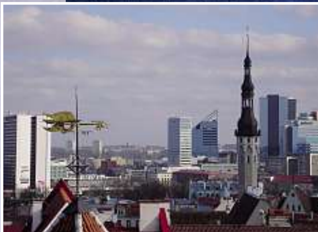
Ansichten von Tallinn