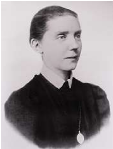
Sel. Maria Theresia Ledochowska